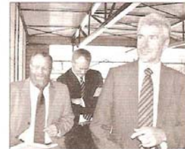
Minister Rupprecht und Bürgermeister Blasig besichtigten auch die Tribüne im Rohbau der Sporthalle.

schulbetriebs hatte die BBIS im Mai 2006 einen Antrag auf Förderung des Neubaus einer multifunktionalen Dreifeldsporthalle gestellt. Pünktlich zum Beginn der diesjährigen Sommerferien erreichte die Schule dann die positive Nachricht von der Bewilligung. Für Minister Rupprecht bilde der Sport einen elementaren Bestandteil im Konzept einer ganztägig betreuenden Schule. Als ehemaliger Sportlehrer und Präsident des Handballvereins 1. VfL Potsdam