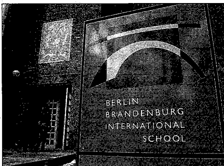
Das ehemalige Reichspostgebäude dient jetzt als Schulhaus.