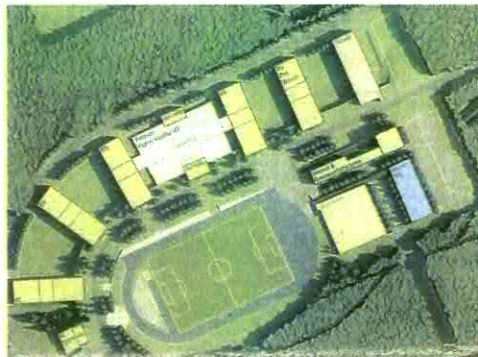
Geplantes Gesamtensemble der Internationalen Schule.