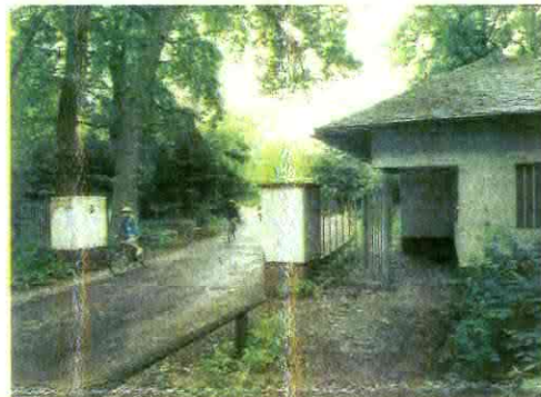
Die bisherige Einfahrt im Osten hat bald ausgedient.

den, die einst die Reichspost errichten ließ. Neu hinzugekommen sind inzwischen ein Stadion und eine Turnhalle.